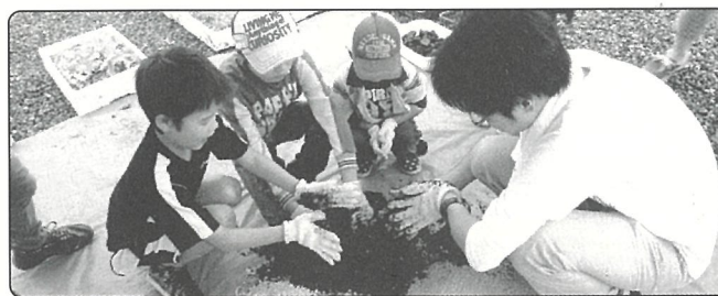
▲河川愛護団体リーバーネット21ながめま