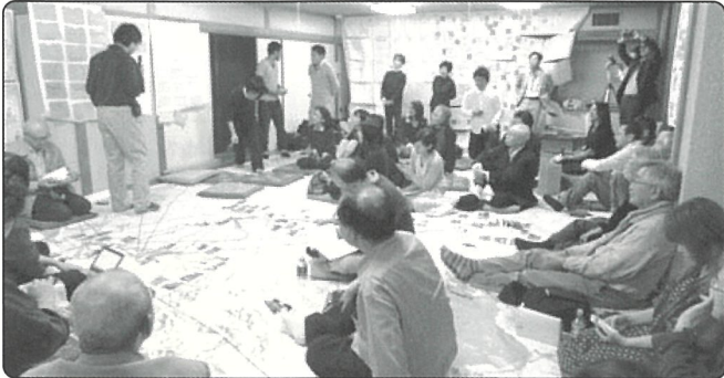
▲NPO法人えべつ協働ねっとわーく

地域における住民の自主・協働によるコミュニティ再生活動や、これらを担う人材を育成することを目的に、コミュニティやまちづくり、NPOなどの地域活動に関心のある方を対象にした講座など、札幌市、江別市、雨竜町、寿都町、室蘭市、帯広市の6市町で開催しました。