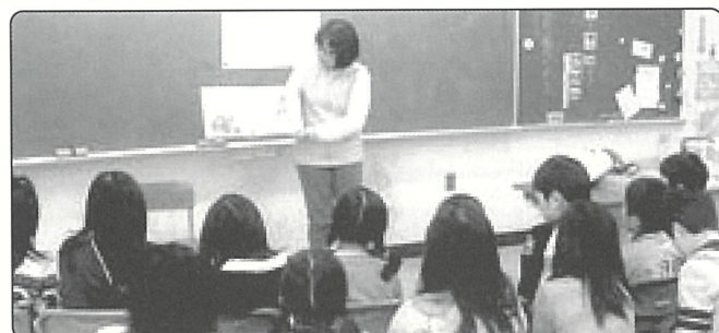
▲道北圏 読み聞かせグループ「こけももの実」(猿払村)