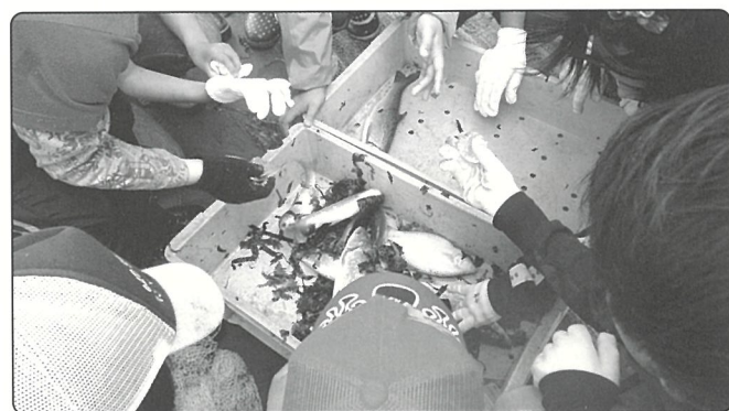
▲認定NPO法人霧多布湿原ナショナルトラスト