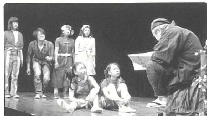
▲NPO法人コンカリーニョ