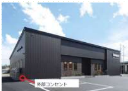
EV導入を見据え、社屋に外部 コンセントを設置<宣誓項目(8)>