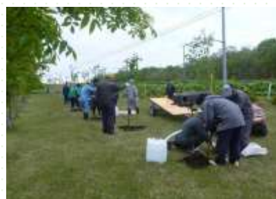
自社敷地内の植樹 <宣誓項目(12)>