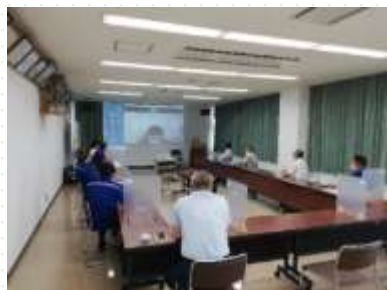
施工現場とのオンライン会議化 <宣誓項目(3)>

ゼロカーボン・チャレンジャーの 取組 は、道の ホームページ で 紹介 しています。