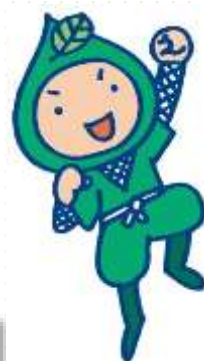
環境忍者 えこ之助